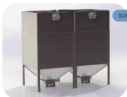
SL003M avec kit pour chargement de autocisterne