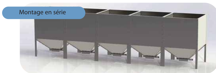
Montage en série